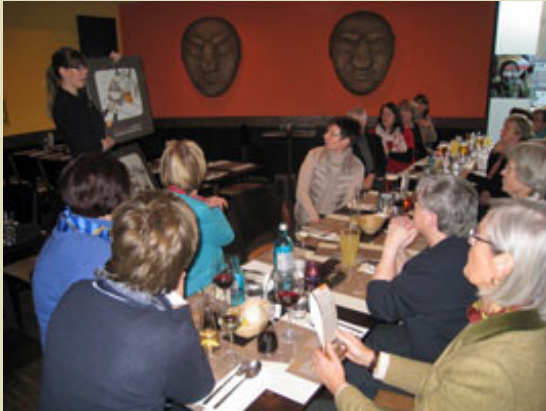
Wie funktioniert Mongo's ?