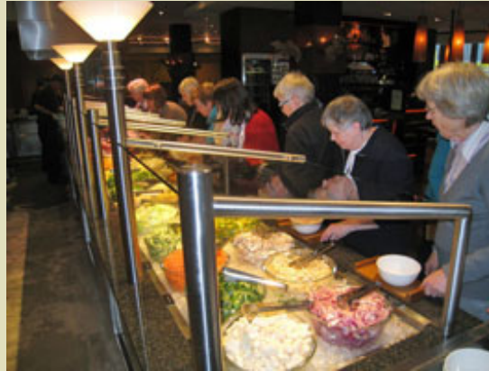
Die Auswahl ist groß!