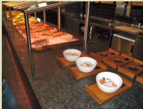
Kommt das wirklich zurück ?