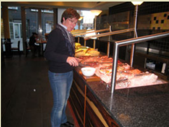
Immer diese Entscheidungen