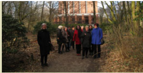
Ein imposantes Gebäude