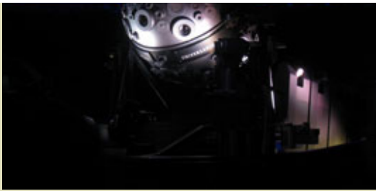
Ein Wunderwerk der Technik