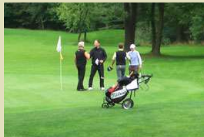
... das Ergebnis ....