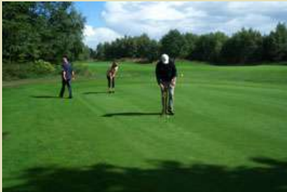
Vorbereitung ist alles, es ahnte noch ...

Am 28./29. August 2010 fanden die Vierer-Clubmeisterschaften statt. Es hatten sich 60 Golfer gemeldet, um bei einem Klassischen Vierer am Samstag und einem Vierer-Auswahldrive am Sonntag den Clubmeister zu ermitteln. Das Spiel am Samstag wurde von vielen Regenschauern begleitet. Nach dem Ausfall von 2 Spielpaaren stand dann die Startliste für den nächsten Tag fest. Am Sonntag wurden aber alle entschädigt. Während der gesamten Runde war es trocken, sodaß jeder besser zu seinem Spiel fand.