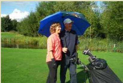
Der Spaß ging nicht verloren.