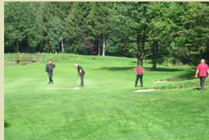
Konzentration beim entscheidenden Putt.