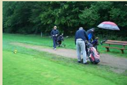
Zweiter Tag, neues Spiel und neues Glück.