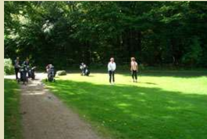
... niemand, wie nass .....