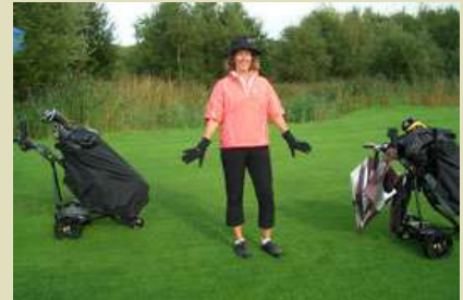
... und kalt es werden würde!