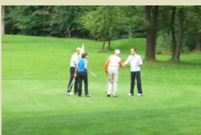
Für wen wird ....