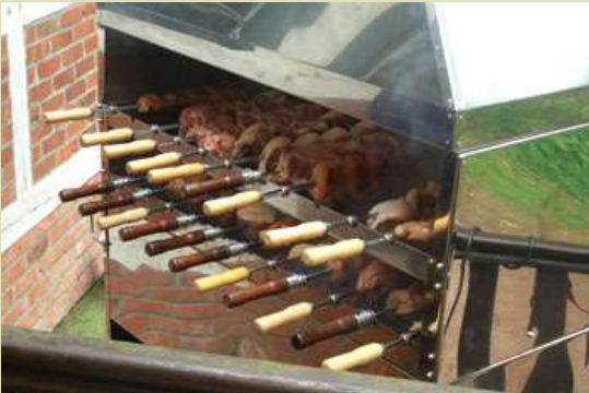
Bei diesen Grillspezialitäten mußte jeder satt werden.