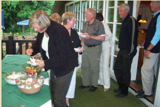
Zum Abschluß gab es ein süßes Dessert.