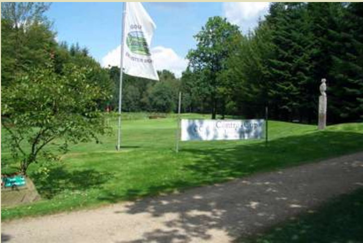
Der Golfplatz war für den Contra Cup komplett vorbereitet.