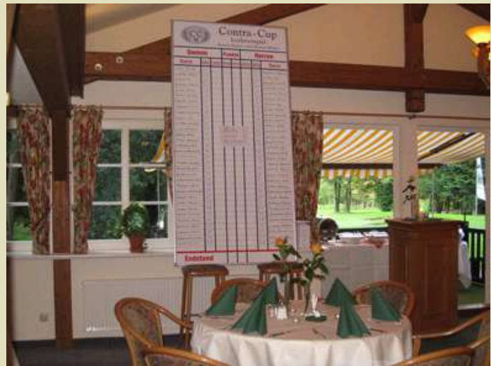
Das Ergebnis der Auslosung bot ausreichend Gesprächsstoff.