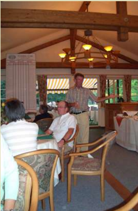
Die Küche des Eysten hatte sich wieder sehr viel Mühe gegeben und ein tolles Buffet gezaubert.