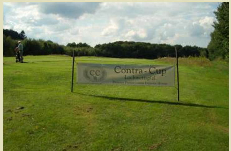
... und Bahn 10.