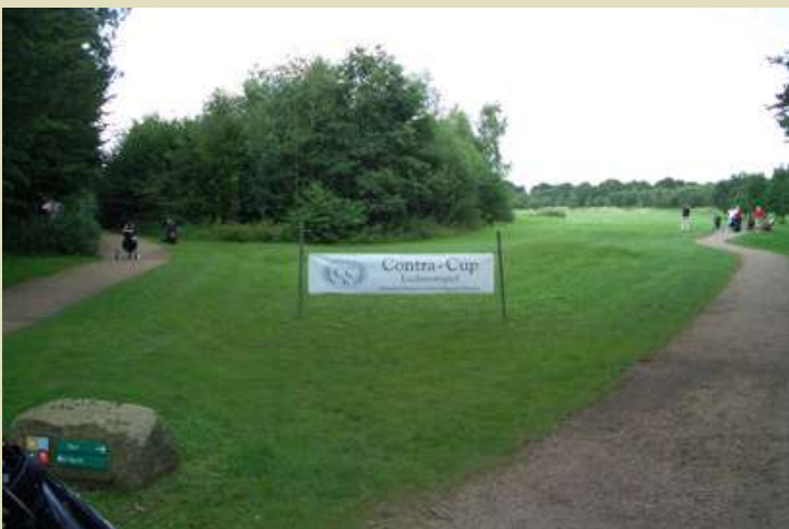
Gestartet wurde auf Bahn 1 ...