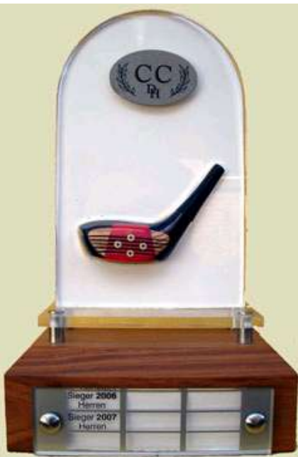
Dies ist das Objekt der Begierde! Der Contra Cup wurde in den Jahren 2006 und 2007 jeweils von den Herren gewonnen.